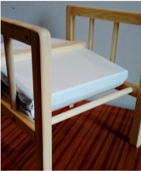
Zadná časť sedadla voľne leží na zadnej plochej tyčke.