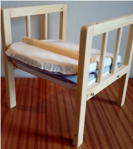
Vložte sedadlo a priskrutkujte prednú tyčku sedadla.