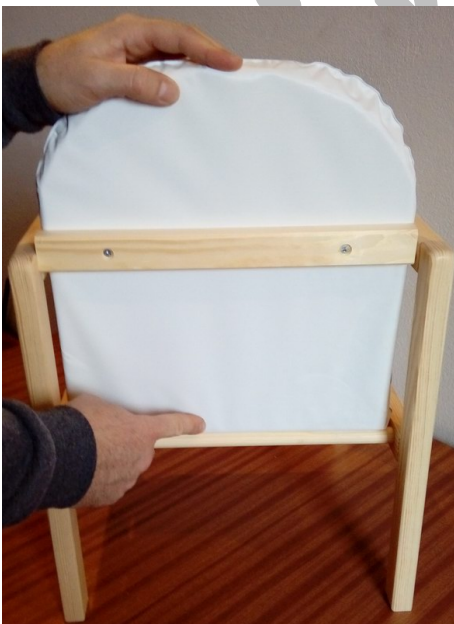
Zdvihnite opierku sedadla. V spodnej časti sa bude opierať o guľatú tyčku.

Dierky hornej tyčky opierky a na ráme stoličky nebudú v jednej rovine!